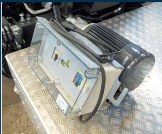
Moteur électrique 230 V auxiliaire à la prise de force (option)