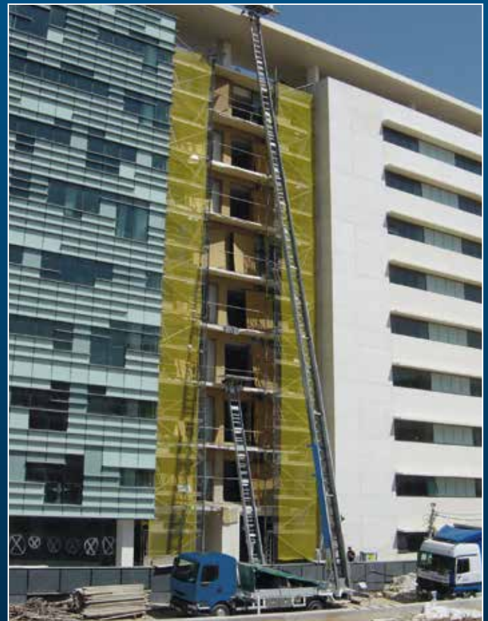
Monte-meubles du type HL 42 / 2 – 9 LH monté sur un véhicule de 8 tonnes