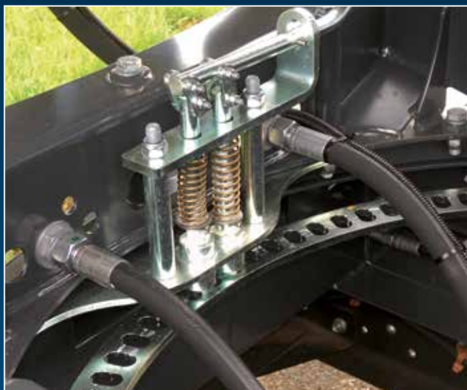
Blocage de couronne pivotante en continu, à déblocage mécanique