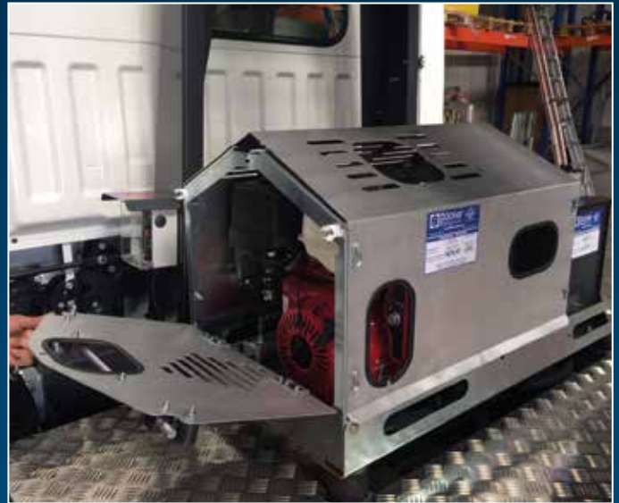
Moteur Honda GX 390 avec caisson de protection