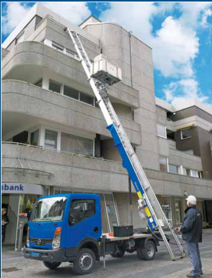
Monte-meubles du type HL 27 / 1 – 6 LH monté sur un véhicule de 3,5 tonnes