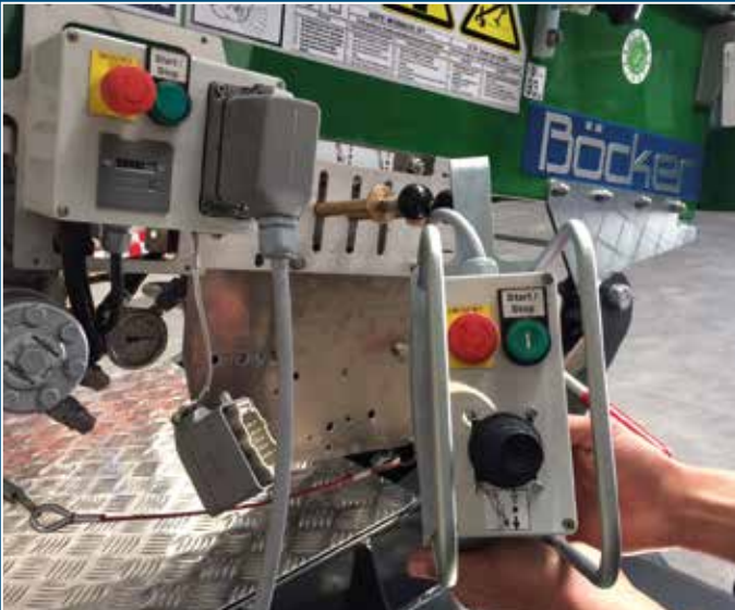
Commande à distance du type joy-stick