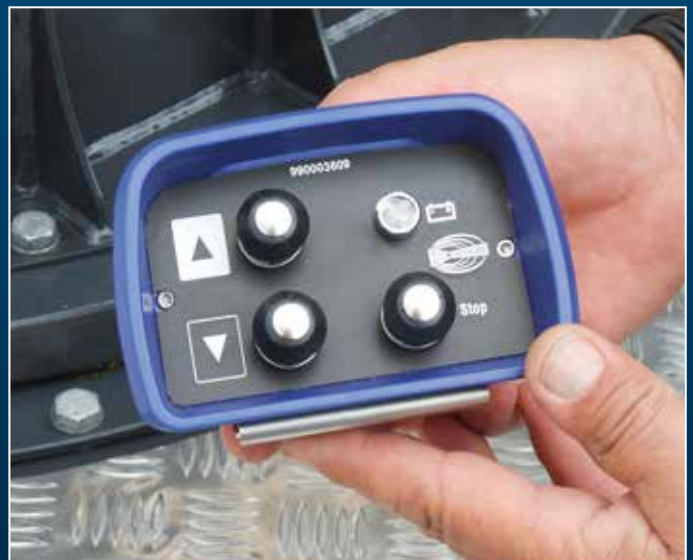
Commande radio (en option)