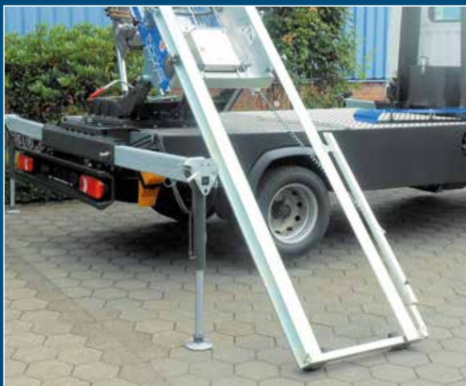
Chargement facile grâce à la rallonge du bas