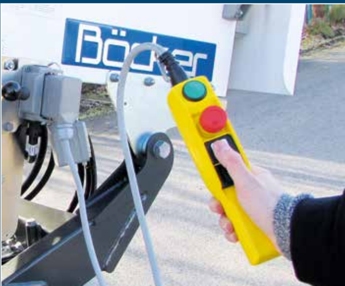
Commande électrique par boîtier sur câble depuis le sol Câble de 4 m