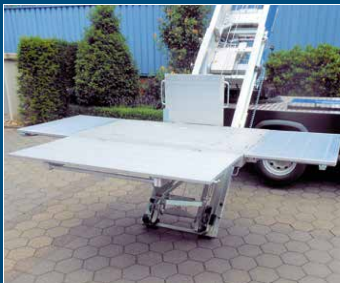
Surface de chargement absolument plane